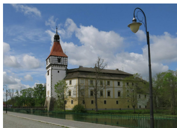
Zámek Blatná, Dobříš a Březnice