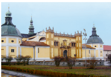
Svatá Hora Příbram